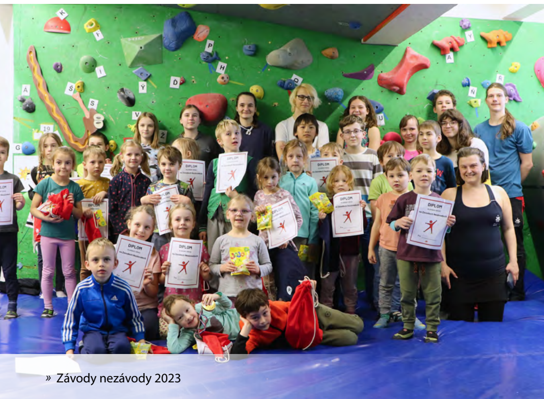
» Závody nezávody 2023

Na Maskův memoriál zveme také závodníky a závodnice z jiných středisek a spřátelených horolezeckých oddílů. Letos tu byli lidé z Českých Budějovic, Plzně a Brandýsa nad Labem, ale samozřejmě nejvíc