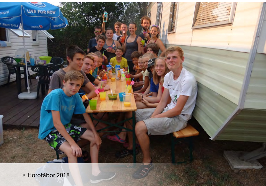
» Horotábor 2018

Vzpomínám si, že jednou jsme jeli závodit do střediska v Českých Budějovicích a cestou zpátky jsme honili vlak. Jeli jsme na nádraží autobusem