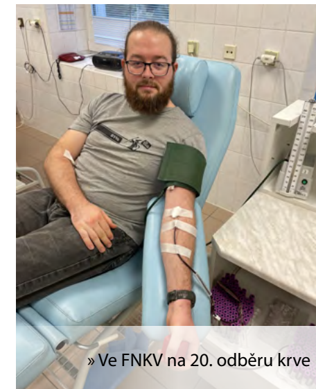
» Ve FNKV na 20. odběru krve