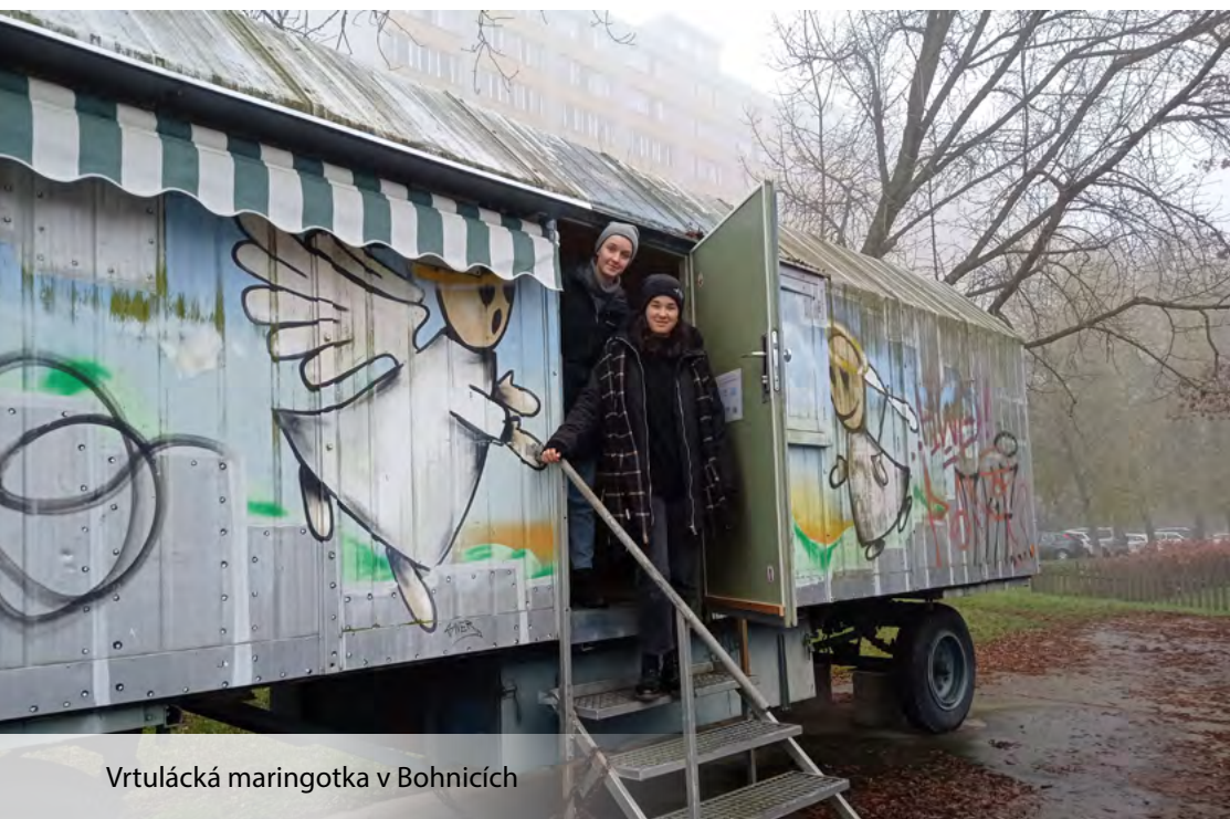
Vrtulácká maringotka v Bohnicích

My jsme to tak dřív mívali, ale nyní začínáme chodit i jinam a střídáme to.