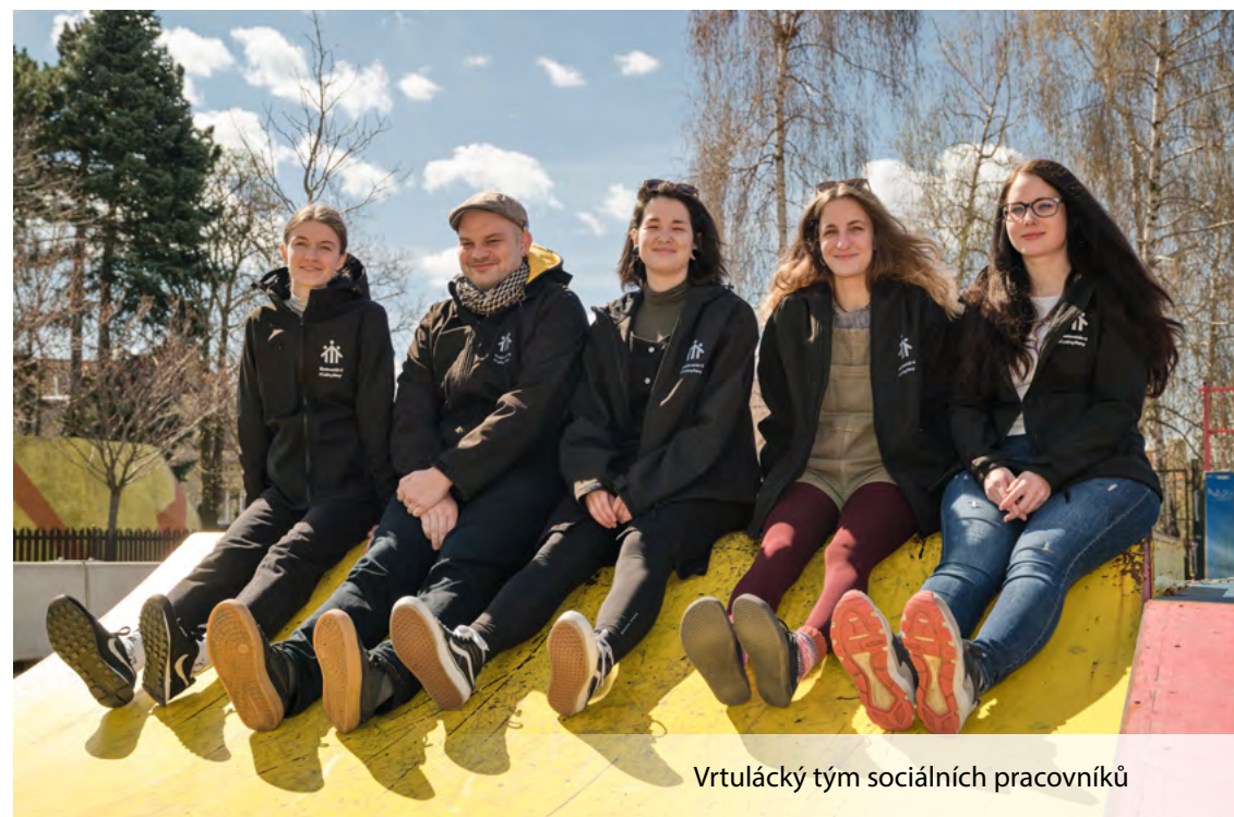
Vrtulácký tým sociálních pracovníků

Ano, my je doprovázíme do následných služeb, kde jsou odborníci, kteří pomohou v té konkrétní situaci.