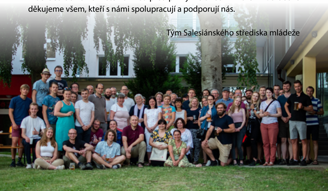
Tým Salesiánského střediska mládeže

Celá tato dlouhá doba byla bohužel poznamenána koronavirovou krizí a zne-možnila nám pořádat spoustu akcí, výjezdů, turnajů a závodů. Na část školního roku jsme museli z nařízení vlády středisko zcela uzavřít a některé aktivity jsme vyučovali distančně. Sociální služba byla uzavřena pouze na pár týdnů v jarních měsících, naopak na podzim mohla pokračovat i v době úplného lockdownu. Přesto všechno se nám podařilo uskutečnit rekonstrukci vstupu do Salesiánského centra a tuto nákladnou stavbu slavnostně otevřít v červnu 2020. Na jaře 2021 jsme trochu změnil tvář venkovního areálu, neboť jsme hned u skateparku vysázeli šest krásných, již vzrostlých stromů, které mají pomoci děti uchránit v létě na hřišti před přímým slunečním zářením. Srdečně děkujeme všem, kteří s námi spolupracují a podporují nás.